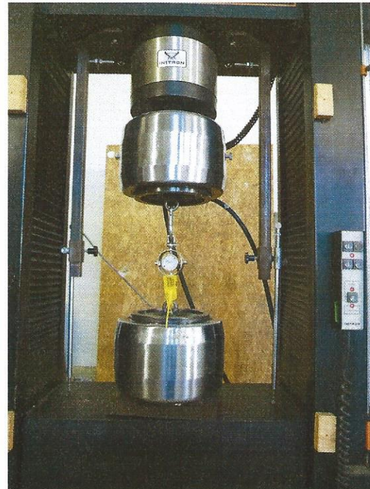
b) sistema di misura del carico.