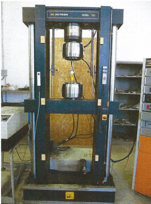
a) dispositivo di prova;